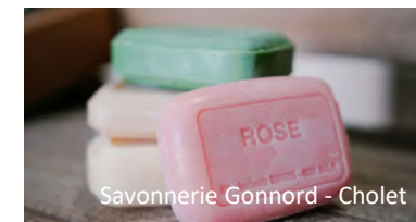
Savonnerie Gonnord - Cholet