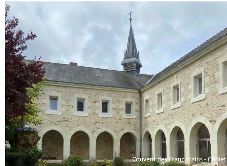
Couvent des Franciscains - Cholet